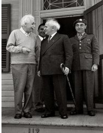
Albert Einstein y el Primer Ministro David Ben-Gurion en Princeton, N.J. 1951.